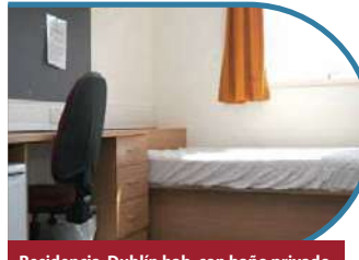
Residencia Dublín hab. con baño privado

Dependiendo del destino, podrás alojarte en residencia, en familia o bien podrías tener ambas opciones disponibles. Si vas a vivir en una residencia, podrás tener una habitación individual o compartida (consulta el programa). El programa de actividades en una residencia es más intenso, ya que después de cenar y hasta las 22:30 siempre tendrás actividades. Las comidas son en comedor y tendrás monitores siempre cerca.